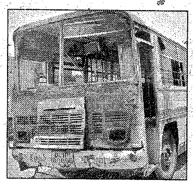
बोटेनिकल गार्डन के पास जली बस।

नोएडा (एसएनबी)। बोटेनिकल गार्डन मेट्रो स्टेशन के सामने बस के इंजन में लगी आग देख लोगों में अफरा-तफरी मच गई। हालांकि चालक ने तत्काल बस को रोक कर सभी यात्री नीचे उतार दिए। सूचना पाकर पहुंची दमकल गाड़ियों ने तत्काल आग पर काबू पा लिया। आग से बस का